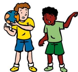
We lossen conflicten zelf op